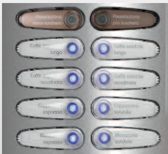
Grandes teclas de tipo electromecánico. Pulsación directa y fiable.