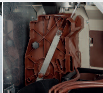
Versión espresso con innovativo grupo de café FAS, capaz de garantizar una excelente calidad del café y una temperatura alta en el primer café.